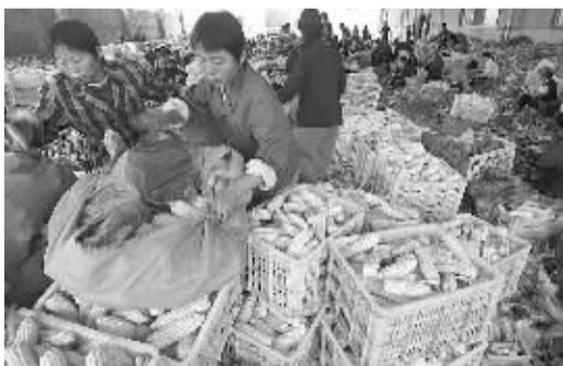
农产品深加工提高了农产品的附加值,也提高了农民的生产积极性,宜秀区白泽乡农产品深加工企业每天从望江、枞阳、宿松等县收购玉米七八十吨。图为加工现场。

办理怀宁县有关企业破产案中,利用职务之便,为行贿人谋取利益,先后多次收受拍卖机构及破产企业资产受让人的贿赂,共计人民币9.1万元。