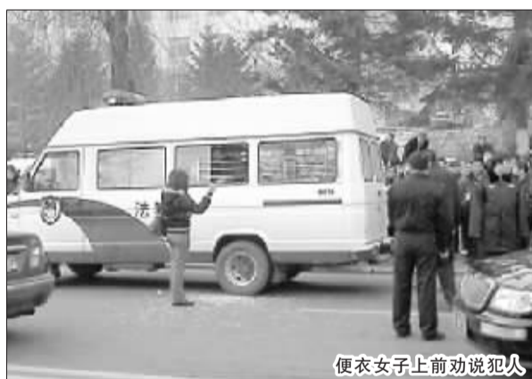
便衣女子上前劝说犯人

事发一侧的路段也开始封闭,民警开始疏导过往车辆、疏散群众,“赶快开走,不要停留。”“所有的人都往人行道上退后。”