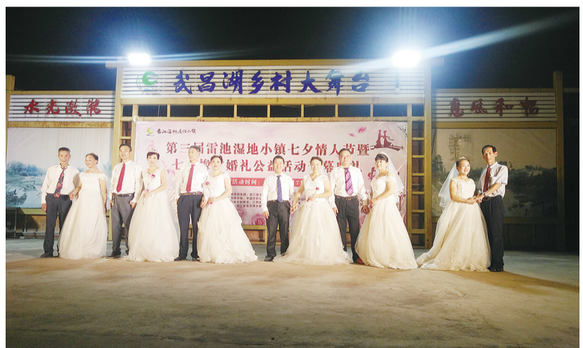
橡树婚礼公益活动现场。

浪漫七夕不是年轻人的专属，今年8月7日是农历传统的七夕节，望江县老委会与雷池湿地小镇一同免费为6对金婚夫妇办“婚礼”。