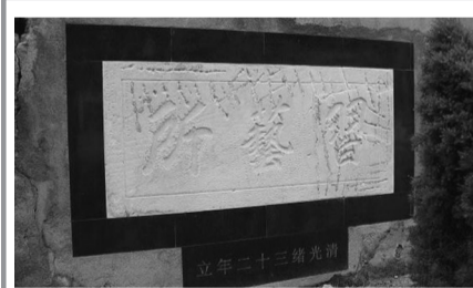
安庆监狱区围墙上的“习艺所”