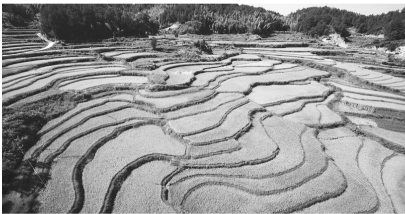
北中镇玉珠村梯田