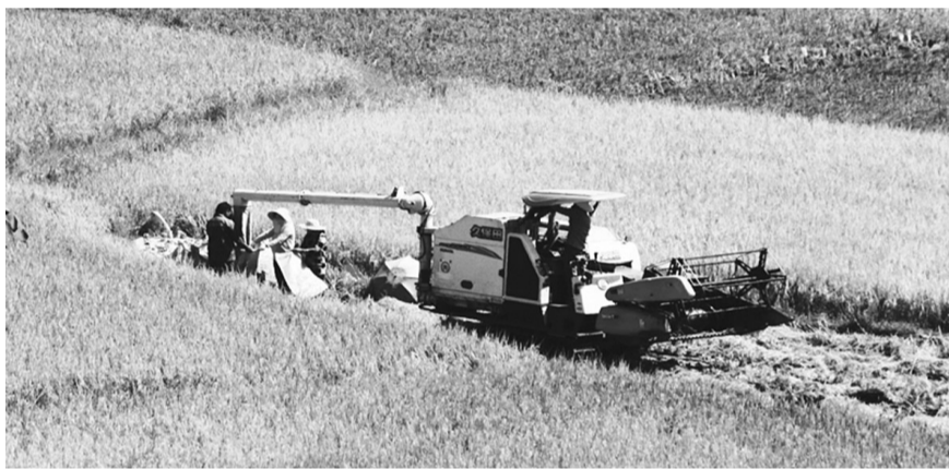
北中镇玉珠村稻田