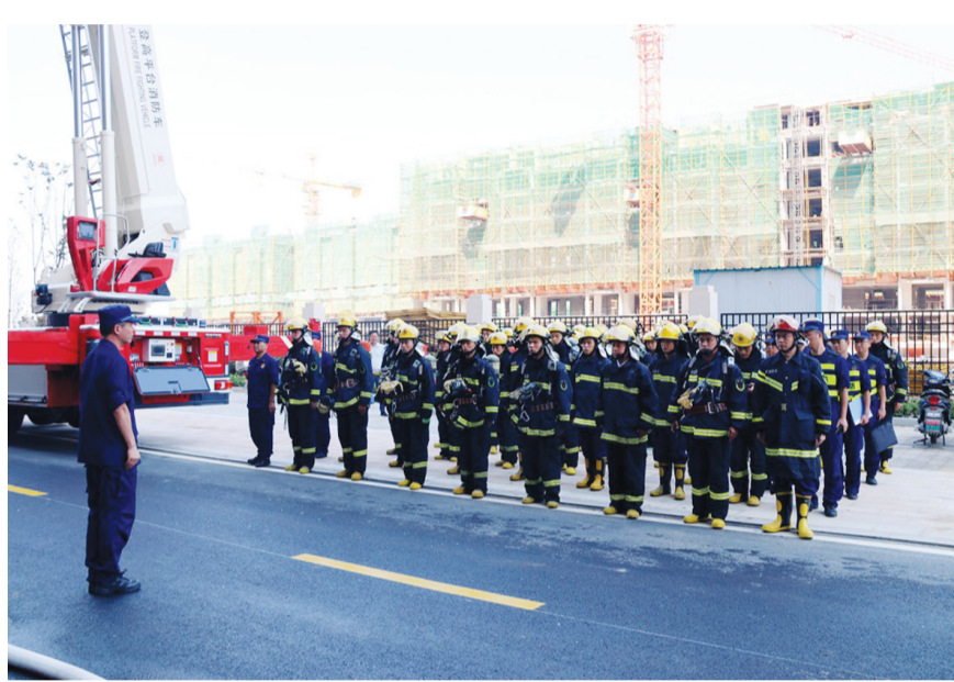
消防救援演练战前动员

今年“十一”国庆节，恰逢新中国成立70周年，举国欢庆、举世瞩目。节日期间，安庆市消防救援支队严格贯彻落实上级和市委市政府有关部署要求，全员参与、全力以赴，紧紧围绕大庆消防安保等中心任务用心用力，强化举措、狠抓工作落实，有效维护了节日期间全市消防安全形势和队伍内部“双安全”“双稳定”，圆满打赢了国庆70周年大庆消防安保决战。