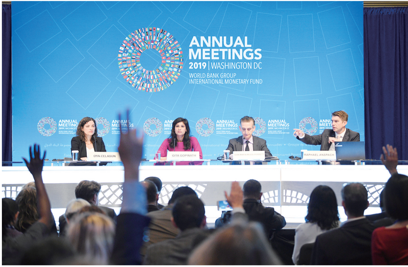
10月15日,在美国首都华盛顿,国际货币基金组织(IMF)首席经济学家吉塔·戈皮纳特(左二)出席新闻发布会。当日,国际货币基金组织(IMF)发布最新一期《世界经济展望报告》,将2019年世界经济增速下调至3%,较今年7月份预测值下调0.2个百分点。这也是2008年金融危机爆发以来最低水平。

国际货币基金组织(IMF)15日发布最新一期《世界经济展望报告》,将今明两年世界经济增速分别下调至3%和3.4%。IMF指出,全球经济正同步放缓,全球贸易急剧恶化及制造业活动低迷是两大主因。 过去一年,全球经济增幅收窄且增长信心不足。在发达经济体,这种疲软态势尤为广泛。这种情况对美国、欧元区经济和亚洲部分发达经济体造成影响,并导致资本市场对全球经济或陷入衰退的恐慌加剧。 在最新报告中,IMF预计发达经济体今明两年经济增速将分别放缓至1.7%,其中美国今明两年经济增速分别为2.4%和2.1%,均未达到美国政府设定的3%的经济增长目标。同时,IMF将今明两年新兴市场和发展中经济体经济增长预期分别下调至3.9%和4.6%,凸显全球经济缺乏增长动力。