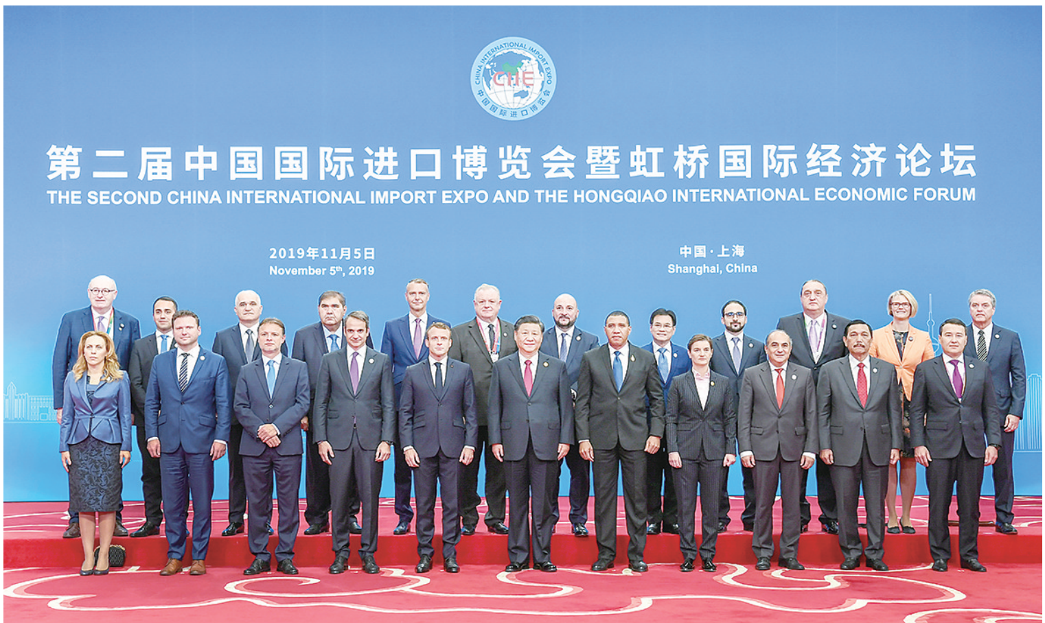
第二届中国国际进口博览会暨虹桥国际经济论坛 THE SECOND CHINA INTERNATIONAL IMPORT EXPO AND THE HONGQIAO INTERNATIONAL ECONOMIC FORUM