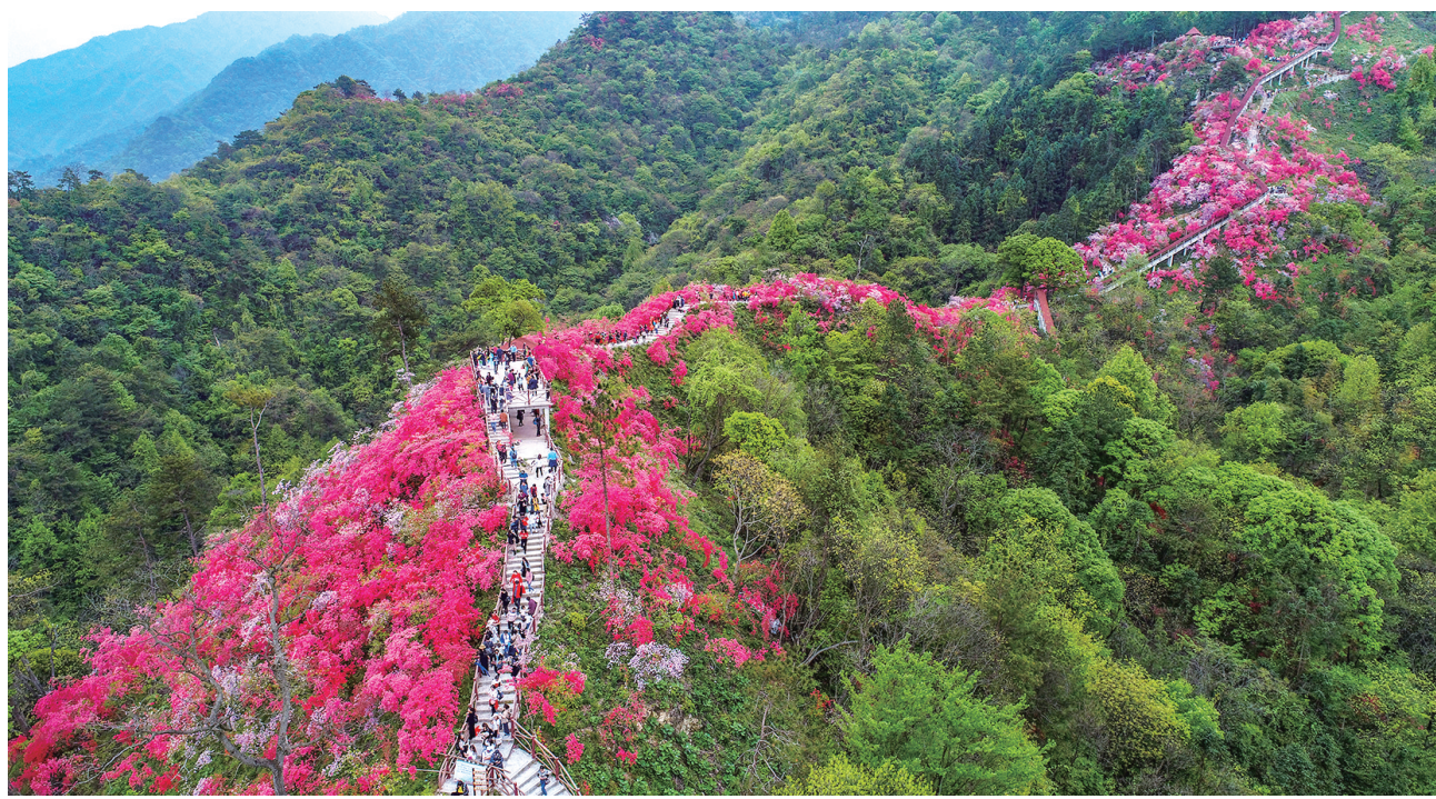
绿水青山就是金山银山,生态岳西吸引着各地游客前来观光游览。

国家级生态县、第二批全国生态文明建设示范区、第三批“绿水青山就是金山银山”实践创新基地、第二批国家农业绿色发展先行区……近年来,多项国字号荣誉相继落户岳西县。曾经交通闭塞的国家重点贫困山区县,有今日之成绩,它的发展密码是筑牢生态底色,坚持绿色高质量发展。