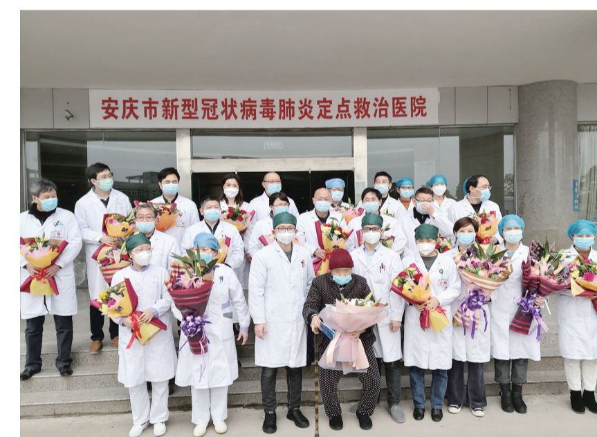
3月4日，医护工作者与最后一例新冠肺炎治愈患者合影。

据了解，全国疫情发展拐点尚未到来，疫情防控仍需高度警惕，不能有麻痹思想、厌战情绪、侥幸心理、松劲心态。交通解封、恢复生产并不意味着鼓励