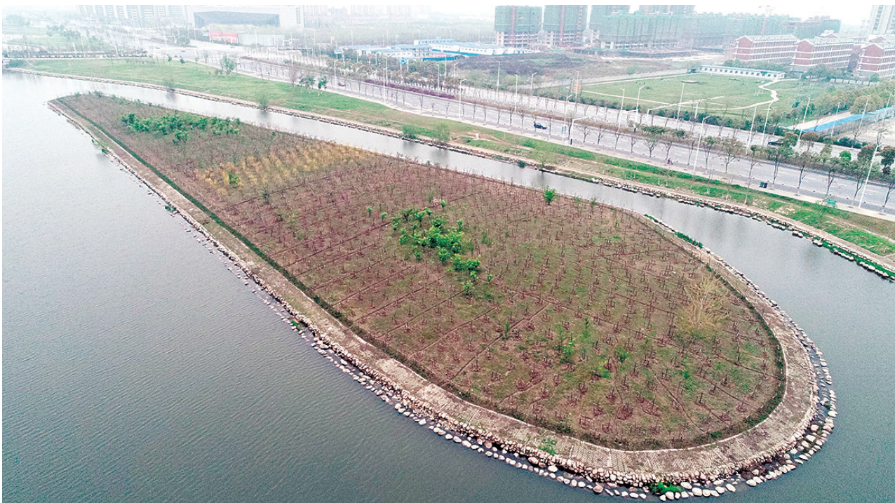
水滴形樱花岛绿化工程完工。

“这是一个人工岛屿,远看像一个巨大的水滴,形状十分好看。明年春天市民便可来此地欣赏樱花等各种苗木。”花木公司负责人说。(记者 陈娟娟)