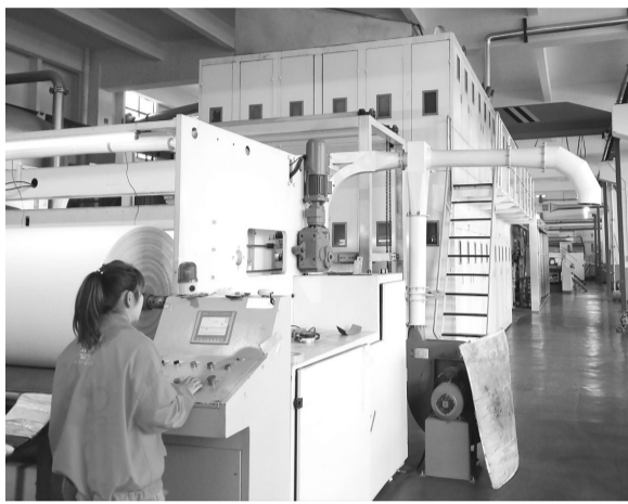
工人正在车间忙碌