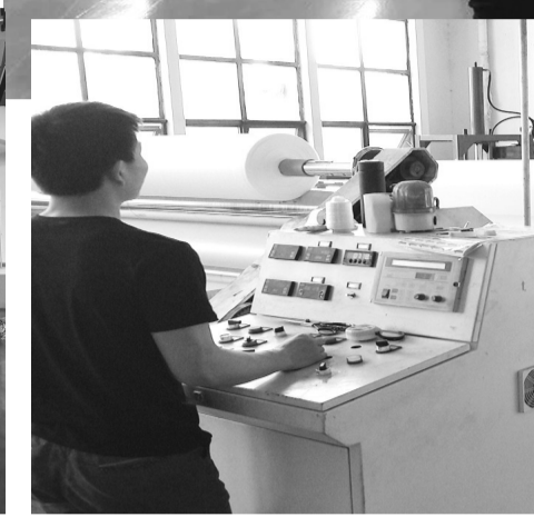
正在生产无纺布的工人