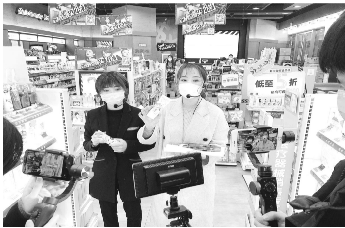
吾悦广场主播正在商店进行直播销售

面向未来,春暖花开。迎江区经济发展的战斗全面打响。项目工地奋战正酣,工厂车间加紧生产,传统产业转型发展……迎江区各行各业迅速按下经济复苏“快进键”,奏响经济社会发展“春之声”。