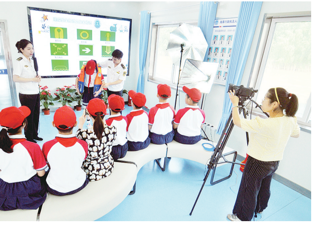
8月26日,在长江安庆段海巡1211艇及海巡1208艇上,由共青团安庆市委、安庆海事局、市教体局联合举办的“水上安全知识进校园”暨暑期防溺水宣讲网络直播活动举行。

影响,个人风险可以接受;社会风险可接受。”谭学群对结论作出解释。 石油化工企业的特殊性不言而喻,工艺上的安全影响长远。本次项目涉及的所有装置均为成熟可靠的生产工艺,且在国内均有同等规模的装置在生产运行。在前期,中国石化还专门组织开展了该项目的安全条件论证,认为项目的工艺是成熟可靠的。 自动化控制程度决定着项目的安全系数。新项目所涉及的生产装置均采用DCS自动化控制系统,在安全保障措施方面,还设置了SIS(安全仪表)系统和GDS(自动检测报警)系统,具有自动检测、报警、联锁、紧急