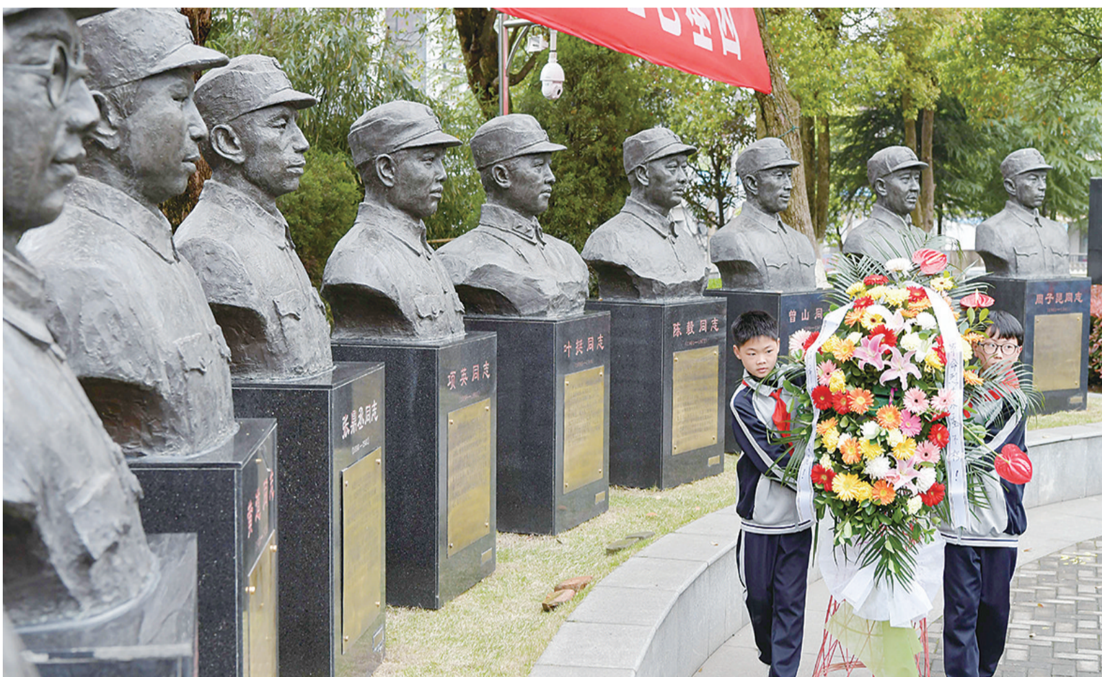
在江西省南昌市新四军军部旧址纪念馆广场,南昌市书院小学学生向革命先辈的塑像敬献花篮(2019年4月4日摄)。

亡先锋的历史责任,发挥了中流砥柱的关键作用。”原中共中央党史研究室研究员王新生说。