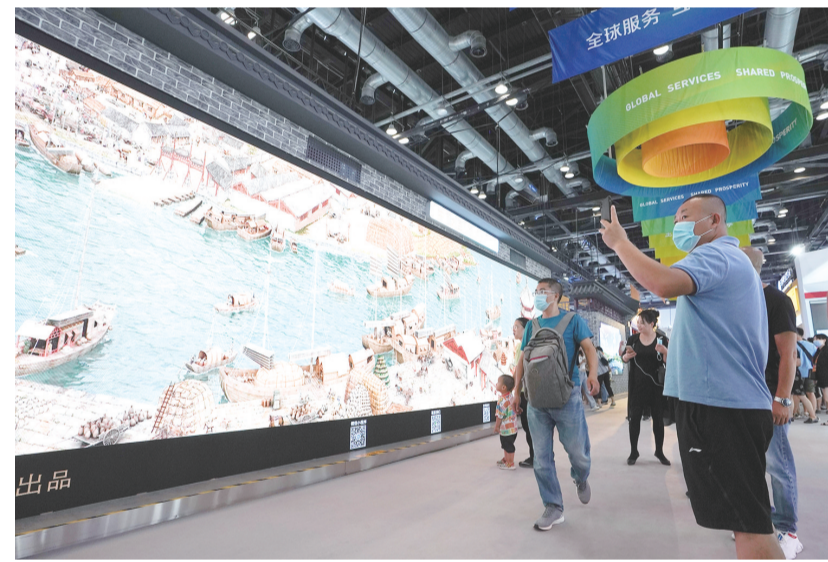
9月6日,参观者在服贸会综合展区参观展出的《穿越时空的大运河》数字影像。记者从北京市商务局获悉,9月5日7点至17点服贸会累计进场9.5万人次。近日,2020年中国国际服务贸易交易会在北京举行。本届服贸会是疫情发生以来我国在线下举办的首场重大国际经贸活动——来自148个境外国家和地区的1.8万家企业机构、超10万人注册参展参会。记者在服贸会展区现场看到观众云集,热闹非凡。

新、制度创新、文化创新以及其他各方面创新,不断把中国特色社会主义伟大事业推向前进,努力使中国特色社会主义展现更加强大、更有说服力的真理力量。正如习近平总书记所强调的:“随着新时代坚持和发展中国特色社会主义的伟大实践不断向前,我们的道路必将越走越宽广,我们的制度必将越来越成熟。”“千磨万击还坚劲,任尔东西南北风”。站立在九百六十万平方公里的广袤土地上,吸吮着五千多年中华民族漫长奋斗积累的文化养分,拥有十四亿中国人民聚合的磅礴之力,我们走中国特色社会主义道路,具有无比广阔的时代舞台,具有无比深厚的历史底蕴,具有无比强大的前进定力。从伟大抗战精神中汲取前行力量,始终保持永不懈怠的精神状态和一往无前的奋斗姿态,矢志不渝沿着中国特色社会主义道路奋勇前进,我们一定能实现中华民族的伟大复兴!(新华社北京9月6日电)