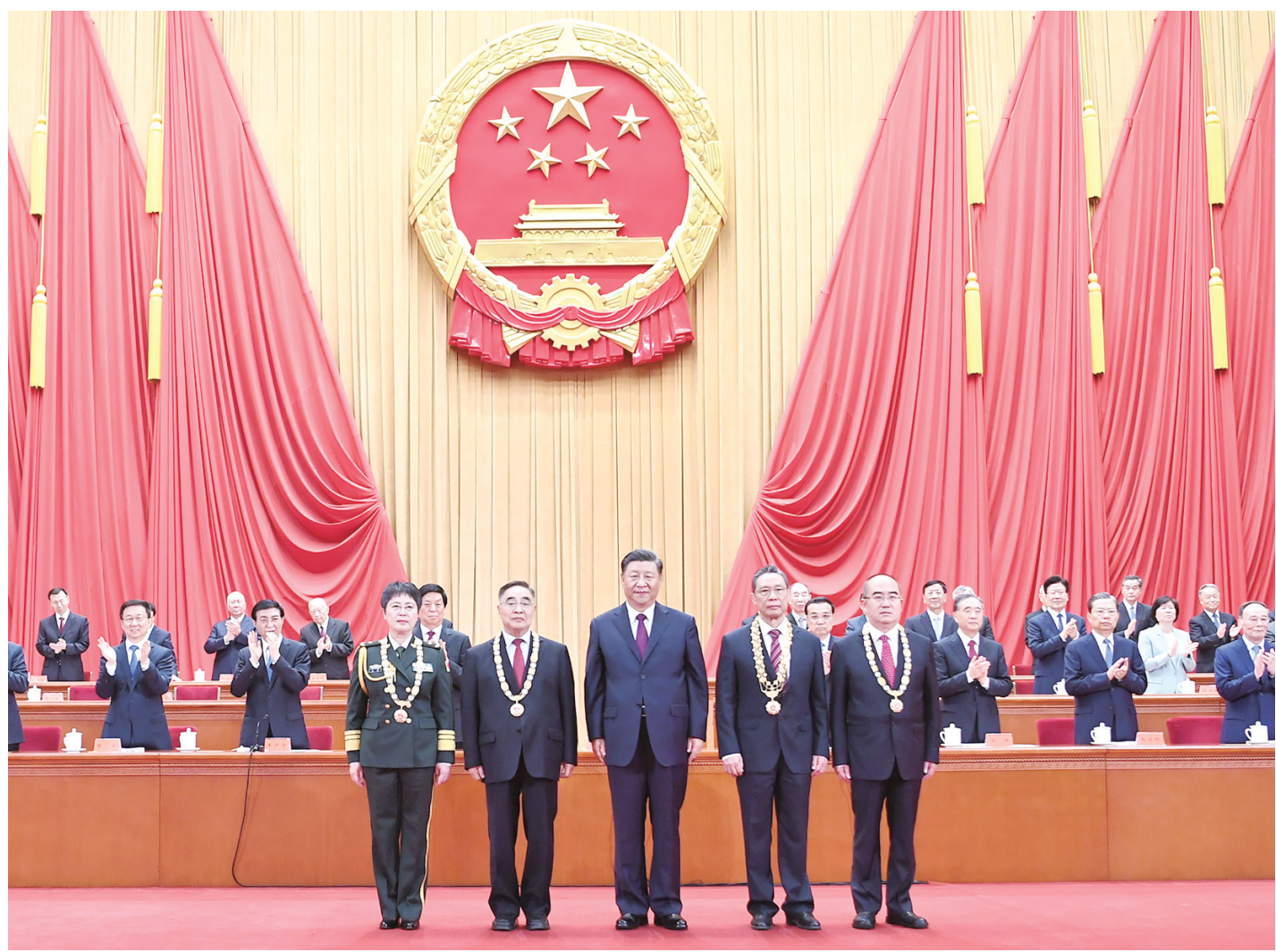
9月8日，全国抗击新冠肺炎疫情表彰大会在北京人民大会堂隆重举行。中共中央总书记、国家主席、中央军委主席习近平向“共和国勋章”获得者钟南山（前排右二）、“人民英雄”国家荣誉称号获得者张伯礼（前排左二）、张定宇（前排右一）、陈薇（前排左一）颁授勋章奖章。

新华社北京9月8日电 全国抗击新冠肺炎疫情表彰大会8日上午在北京人民大会堂隆重举行。中共中央总书记、国家主席、中央军委主席习近平向国家勋章和国家荣誉称号获得者颁授勋章奖章并发表重要讲话。习近平强调，抗击新冠肺炎疫情斗争取得重大战略成果，充分展现了中国共产党领导和我国社会主义制度的显著优势，充分展现了中国人民和中华民族的伟大力量，充分展现了中华文明的深厚底蕴，充分展现了中国负责任大国的自觉担当，极大增强了全党全国各族人民的自信心和自豪感、凝聚力和向心力，必将激励我们在新时代新征程上披荆斩棘、奋勇前进。