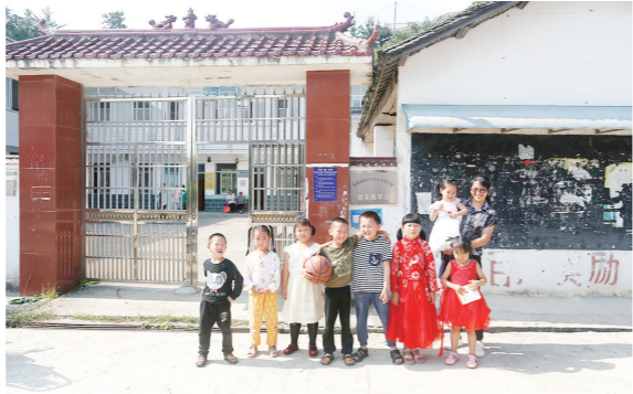
联圣教学点全体师生。