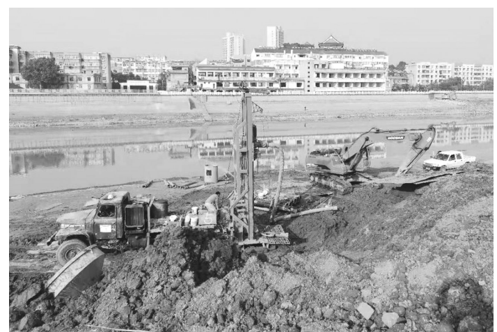
日前，引江济淮节制闸水位计台工程在桐城市鲟鱼镇北堤打下第一桩。据了解，该工程工期预计三个月，工程建成后，将直接观测节制闸及江河地表水位，为水资源配置、水环境评价和防汛防洪提供水文数据支撑。