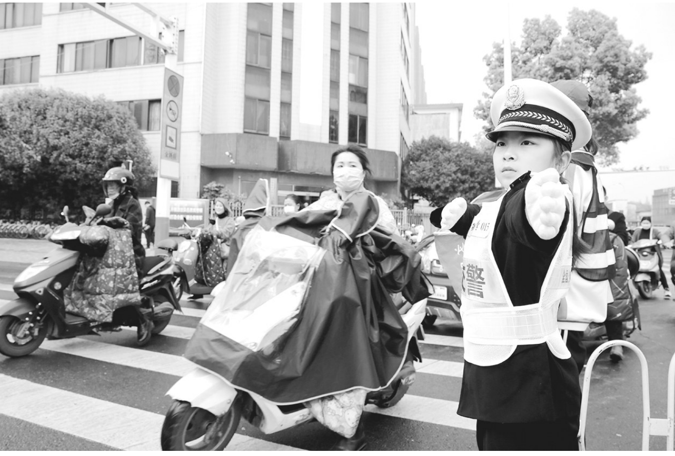
3月28日,“小交警”在民警的指导下上岗体验指挥交通。为了迎接第26个“全国中小学安全教育日”活动,市公安局交警支队二大队组织学生开展“守规则除隐患、安全文明出行”主题实践教育活动,通过参观警营、安全知识宣讲、参与交通文明劝导等方式,让学生们了解交通安全知识,提升学生交通安全防范意识。