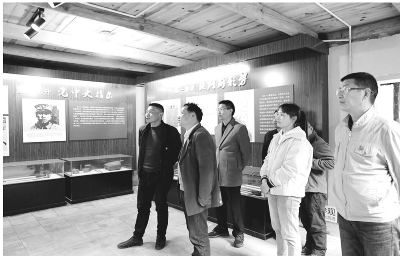
4月1日,岳西县古井园保护区党支部到红二十八军南田会议旧址开展红色党史教育活动。活动当天,党员参观瞻仰了红二十八军南田会议旧址,全体党员们从一件件实物中品读,感受到革命的不畏牺牲、甘于奉献、敢为人先的崇高品质。