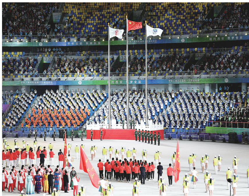
中华人民共和国国旗、中华人民共和国运动会会旗、第十四届全国运动会会旗在开幕式现场飘扬。

入场仪式完毕，全场起立，高唱中华人民共和国国歌。在雄壮的国歌声中，五星红旗冉冉升起，迎风飘扬。陕西省、国家体育总局负责同志分别致辞。