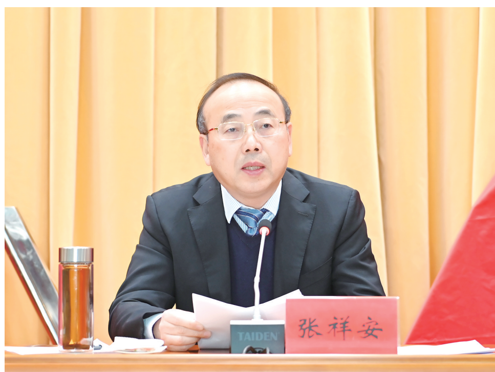
市委书记张祥安在中共安庆市委十二届二次全会上讲话。

张祥安强调,做好明年经济工作,要坚持稳字当头、稳中求进,以经济基本盘的稳和高质量的进,稳经济增长、稳社会基本盘。要主动拉高标杆,切实增强“慢进是退、不进更是退”的危机感和紧迫感,围绕“五年倍增”大目标,用“奋力一跳”的劲头,把“争”的参照物定得更高些,把“进”的目标定得更远些,明年各项主要经济指标增速都要力争进入全省第一方阵。要加快产业升级,启动实施三次产业高质量协同发展行动计划,工业方面要围绕规上工业增加值“翻番”目标,实施“一十百千”