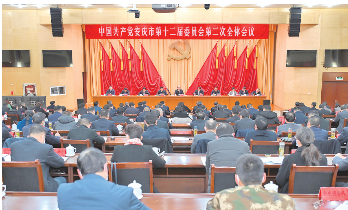
12月30日下午,中共安庆市委十二届二次全会会场。

产业工程和优质企业引育、上市企业倍增、数字赋能、质量提升等行动,挺起安庆工业脊梁;服务业方面要打造“基金丛林”的金融生态,打响安庆会展品牌,大力发展现代物流业,推动文旅产业发展;农业方面要实施“两强一增”行动计划,提高农业劳动生产率和投入产出率。要坚持大抓项目,把主要时间和精力花在项目工作上,谋划一批投入产出效益高的优质项目,招引一批30亿级、50亿级、百亿级重大项目,真正打响“满意办”营商环境品牌,以有效项目投资带动高质量发展全局。要勇于改革创新,充分发挥安庆籍院士、知名专家作用,以科技创新引领产业升级;深化财