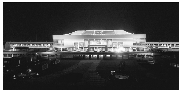
夜晚下的高铁站