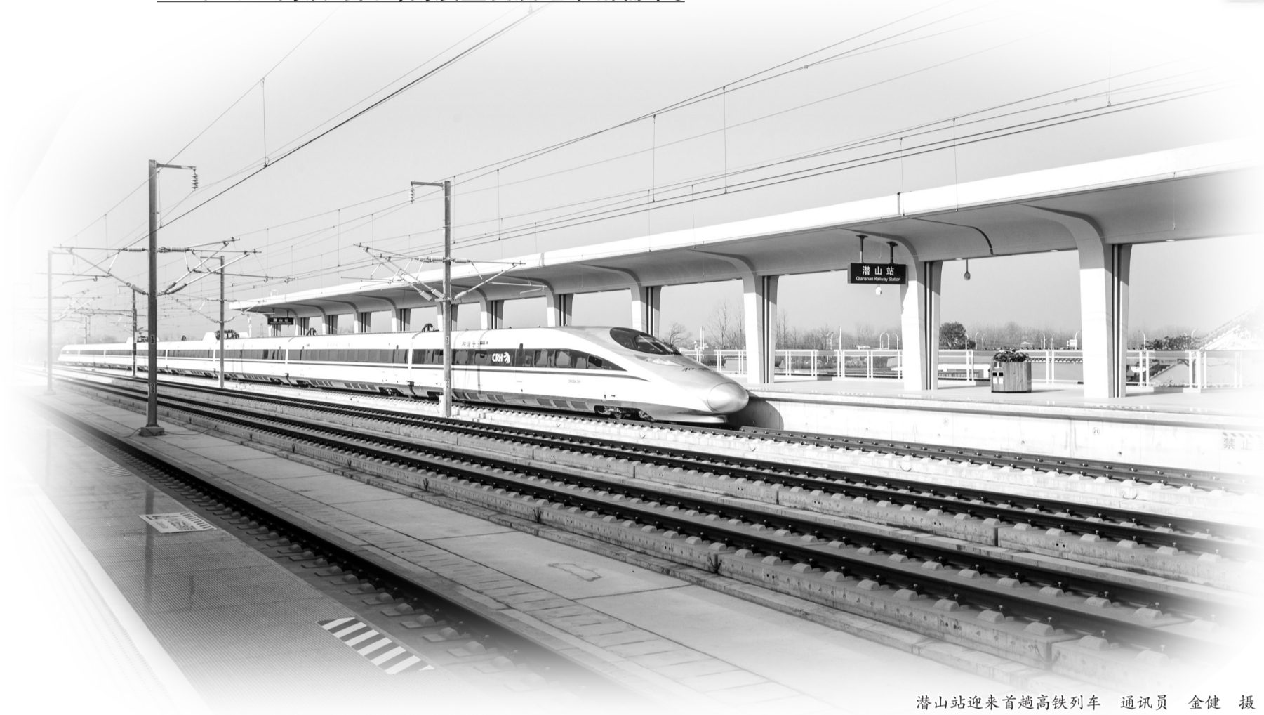
潜山站迎来首趟高铁列车