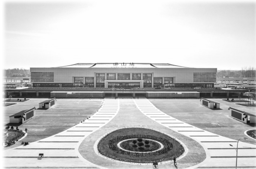
潜山高铁站外景

这是潜阳大地上第一次出现高铁飞驰,标志着潜山高铁正式通车,意味着潜山正式迈入“高铁时代”,高质量发展迎来新篇章。