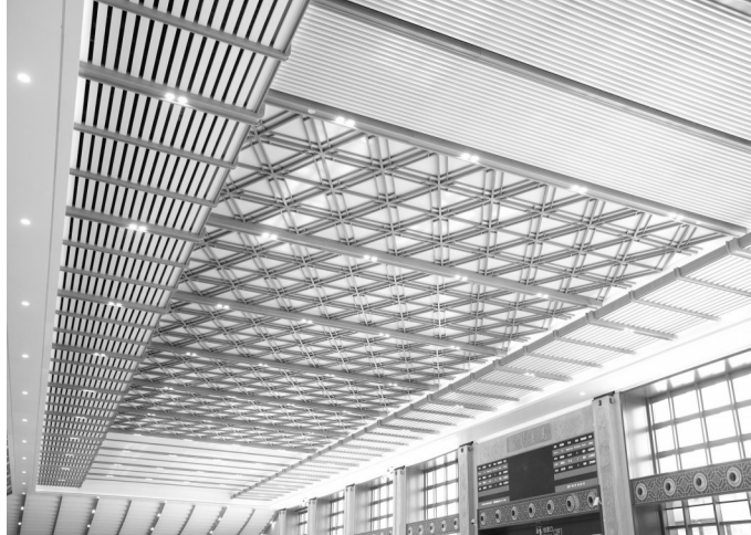
高铁站候车厅