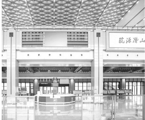
高铁站进站口