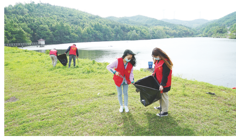
4月14日,怀宁县石镜乡青年志愿者在红星水库周边捡拾垃圾。今年以来,该县深入开展全域环境整治,擦亮乡村旅游高质量发展的美丽“底色”。

现“办理一案、整治一片”效应。 奶茶饮品店销量大、影响广、受众集中于青少年。该县检察院干警对辖区内奶茶饮品店开展专项巡查。重点检查奶茶店环境卫生及存储的食品原料情况,检查现场发现个别奶茶店存在食材存放不当、使用变质水果与过期原料等食品安全问题。检察干警现场配合有关行政执法人员固定证据,依法督促及时全面履行监督管理职责。该院还将视情开展“回头看”,确保有关问题整改到位。(通讯员 方唐亮)