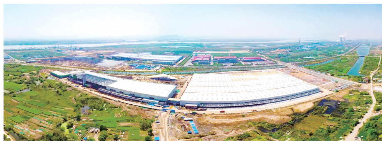
正在建设中的江淮安庆年产10万辆新能源乘用车搬迁项目。

“通过以上率下、示范引领,带动广大干部群众关注、支持、参与、服务‘双招双引’,迅速在全市掀起‘双招双引’的热潮。”