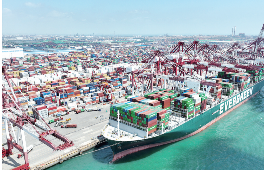
山东港口青岛港前湾港区,集装箱货轮在码头装卸集装箱(6月15日摄,无人机照片)。青岛海关数据显示,今年1月至5月,青岛直达金砖国家的航线共完成箱量83万标箱,同比增长12%,其中出口量增长26.1%。

自2006年序幕开启,金砖国家合作已走过16个年头。金砖国家优势互补,不断深挖合作潜力,拓宽合作领域,成为新兴市场和发展中国家联合自强的典范。 在当前世纪疫情百年变局叠加共振、国际格局加速演变、世界经济复苏任重道远的背景下,金砖国家不断深化共识,加强合作,为应对全球挑战贡献“金砖主张”,为全球发展贡献“金砖力量”。