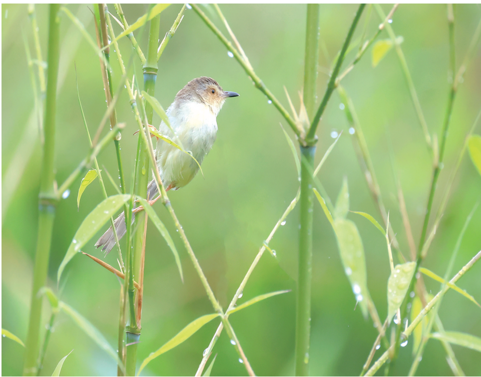
雨中遐思 石颖 摄