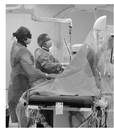
方元实和当地医生共同为患进行手术。