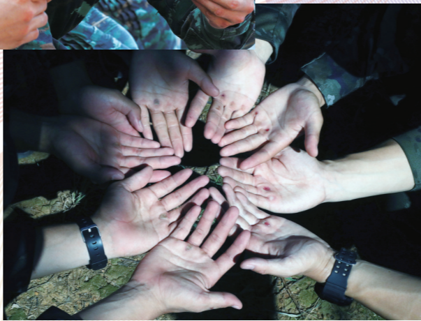
图① 图② 图③ 图④ 图⑤

图①:伏日炎炎,一场训练下来,汗水湿透衣帽。 图②:训练中,汗水流进眼里。 图③:干部为新兵示范攀绳动作要领。 图④:科学训练,保障有力,清凉送到练兵场。 图⑤:掉皮掉肉不掉泪,新战友在训练中掌心磨破。