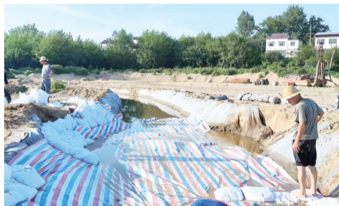
▲怀宁县黄龙镇千群在开挖蓄水池。