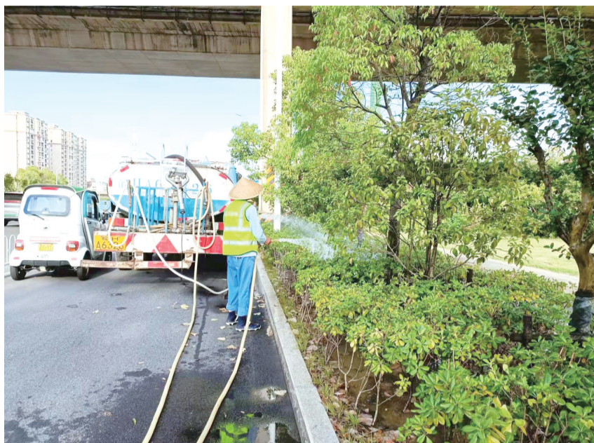
城区皖江大道附近工人正在对绿化进行“补水”。

目前，城区3座水厂累计具备每日36万吨的供水能力，能够满足高温天气城市的用水需求。