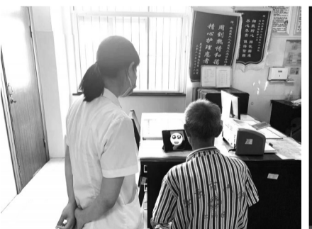
为老年患者开展线上探视服务。