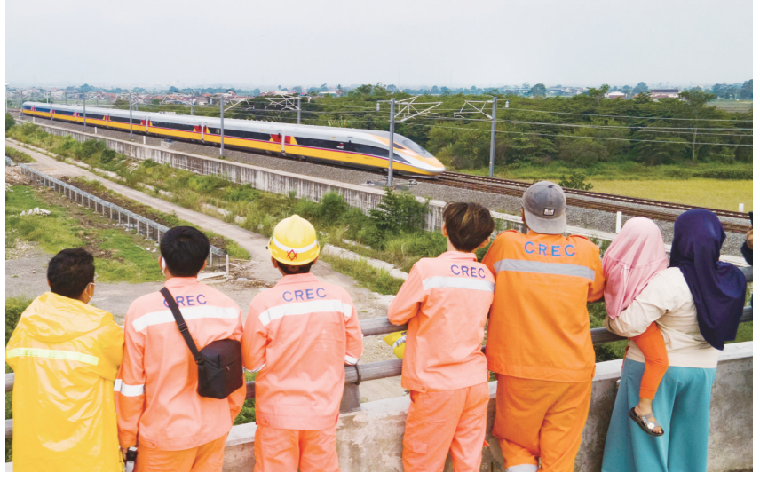
11月16日,雅万高铁建设者和当地民众观看高速铁路综合检测车行驶在雅万高铁试验段。

限公司向印尼埃塔纳生物技术公司所转移的mRNA技术的生产基地启用。印尼总统佐科在参与启动仪式时表示,印尼本地生产商掌握这项技术,对印尼未来防控新的疫情至关重要。