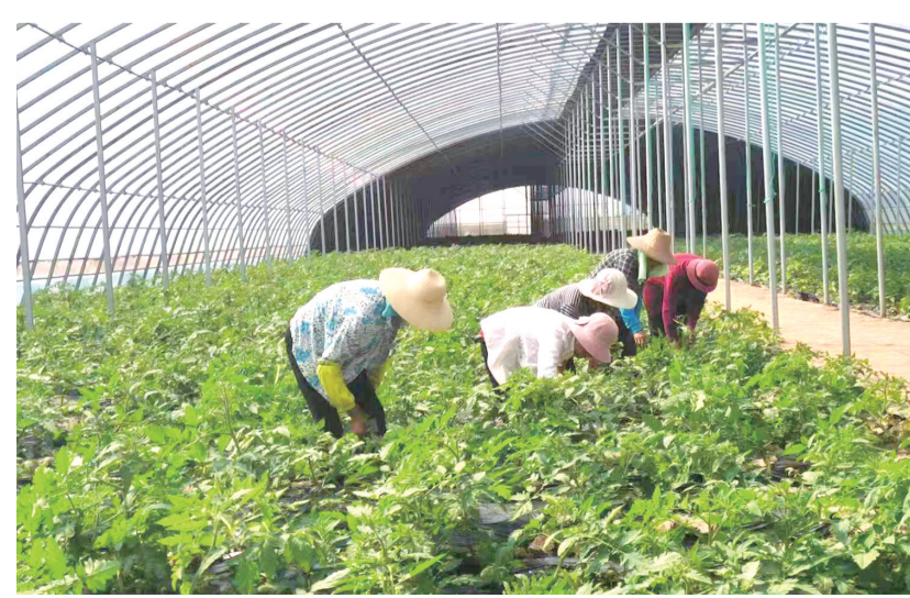
5月23日,在望江县太慈镇红庙村蔬菜基地务工的村民正在采收蔬菜。今年是该蔬菜基地进行产销一体的第5年,目前,该村已建设现代化设施农业蔬菜基地2900余亩、分拣加工中心1家,有效带动当地14个村集体和村民增收致富。 全媒体记者 黄有安 通讯员 郝正旺 摄

了解生产经营情况,着力帮助企业解决制约发展的瓶颈问题,一方面建立规范、高效的帮办机制,依托6个营商环境监测点,对落地项目开展全方位跟踪服务。今年以来,已为企业提供业务指导、政策咨询、金融需求等有效服务50余次。 该镇通过有效的为企业服务,投资56亿元智能终端触摸屏产业园等项目建设正在稳步推进。接下来,将结合工作特点和便民服务需要,打造综合高效的政务服务平台,实行“一站式服务”“一门式办理”,着力解决企业和群众办事遇到的困难,提升政务服务窗口服务质量,全力畅通政企沟通渠道,助推企业高质量发展。 (见习记者 管伟 通讯员 徐海海)