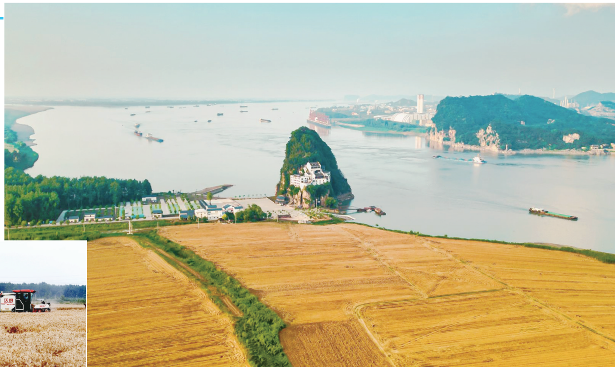
5月25日,在大观区海口镇的家庭农场麦田里,大型收割机正在收割麦子。眼下,大观区海口镇、皖河农场近7万亩小麦正陆续开镰收割。