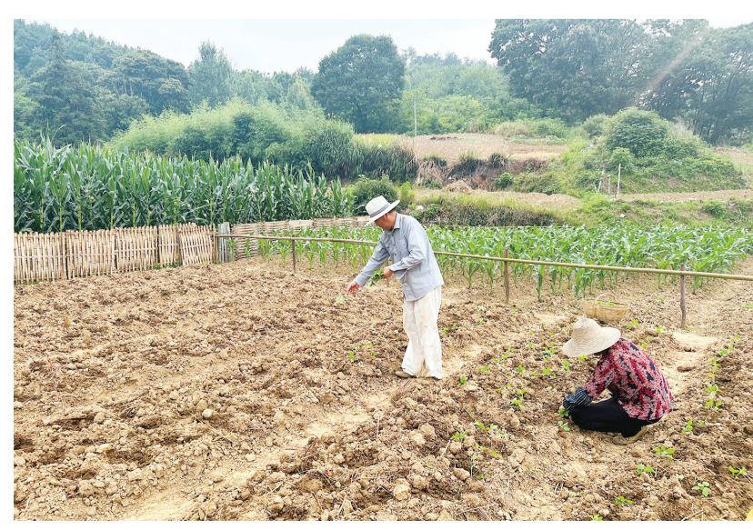
6月21日,怀宁县清河乡村民在开荒的山地上种植芝麻。清河乡属山区乡镇,山多地少,该乡村民立足山区资源优势和气候特点,见缝插种,实现增绿又增收。

按照脱贫县农业排灌用电电价进行结算,预计能为全市农业排灌和抗灾用电节省电费138.18万元。据气象部门预测,今年6月至8月,全市降水量较常年偏少,部分地区有阶段性气象干旱发生。成功争取农业排灌和抗灾用电指标,对全市后期可能发生的旱情作用巨大。根据往年惯例,10月份我市还可向省应急厅争取一批农业排灌和抗灾用电指标。(全媒体记者 沈永亮 通讯员 刘亚魁)