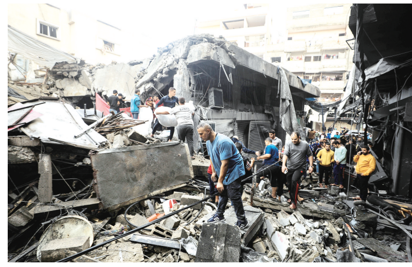
11月15日，在加沙地带南部城市汗尤尼斯，人们查看遭以色列空袭后的建筑废墟。

决议由马耳他起草，获得安理会15个成员中12个成员支持。美国、英国、俄罗斯投了弃权票。在安理会就决议草案进行表决前，俄罗斯对决议草案提出口头修正案，呼吁立即实行持久和持续的人道主义休战，从而促成敌对行动的停止。俄罗斯的修正案未能获得足够的赞成票。