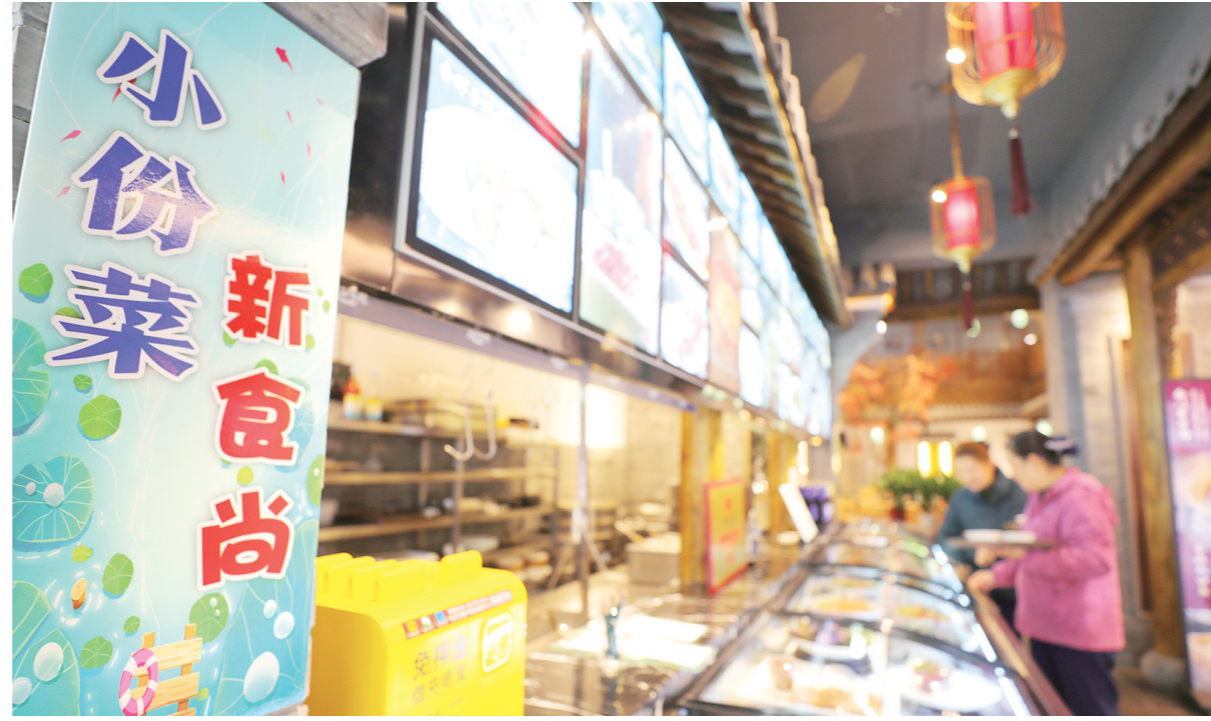
11月20日,顾客在迎江区天台里一家酒店大厅点菜区挑选“小份菜”。

和“大份”菜的价格。例如,小份的“小炒黄牛肉”价格为39元,大份的价格为59元。“‘小份菜’的份量都在一半以上,并且有一些菜因摆盘等问题,‘小份菜’份量与整份的份量几乎相差无几。”符海清介绍,该酒店能够同时容纳近180人就餐,“小份菜”推行以后,点的顾客也比较多。“如果一道来的客人只有两三个人,我们工作人员就会向他们推荐‘小份菜’,一来可以防止浪费,二来可以多品尝几个菜式。”符海清说,推行“小份菜”的初衷是防止餐饮浪费,“我们餐饮从业者和顾客爱惜粮食、防止浪费的意识都有了较大提升。以点餐为例,即使顾客没有点‘小份菜’,我们工作人员在看了顾客点的菜单以后,如果明显过多就会请顾客先删除几个,等不够吃再加。一些顾客在用餐途中要加一些菜,我们可能就建议他们加‘小份菜’。” 几乎每个周末,市民姚恒都会带家人外出就餐。“平时工作忙,应酬也多,周末就想多陪陪孩子们,带他们吃点好吃的。”姚恒说,每次一家四口出门,吃饭的“战斗力”都很弱,点菜也成了大难事。“火锅和烤肉这些重油重辣的小孩子不怎么感兴趣,我们去得最多的还是中式餐饮店。点菜时,如果是大菜,一个菜就够一家人吃了,感觉又没吃到花样;菜点多了,即使打包回家,有时