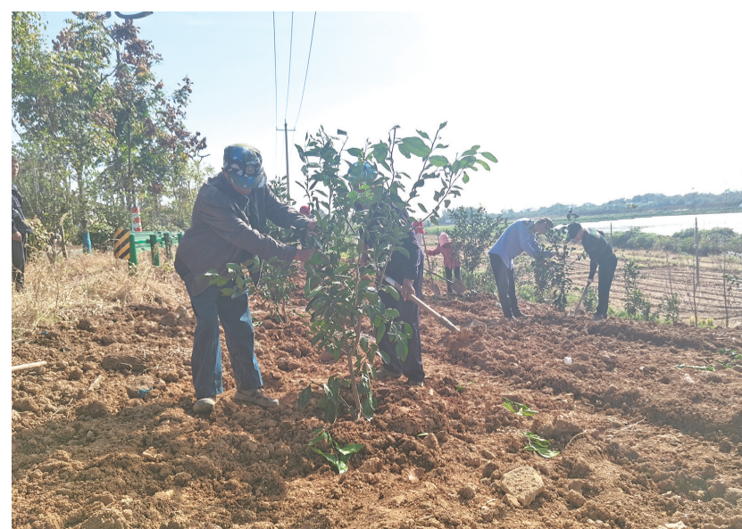
近日,怀宁县小市镇永南村组织村民清除杂草丛生的闲置撂荒地,种下近千棵沙枣树,明年即可挂果,预计每年可为村集体经济增加数万元。