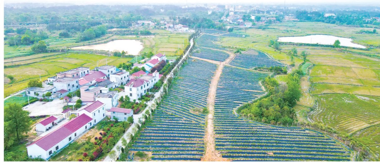
怀宁县公岭镇三铺村航拍图。

风貌提升更需久久为功。在新时代和美乡村建设中,三铺村将围绕生态绿色发展、文化传承保护,实