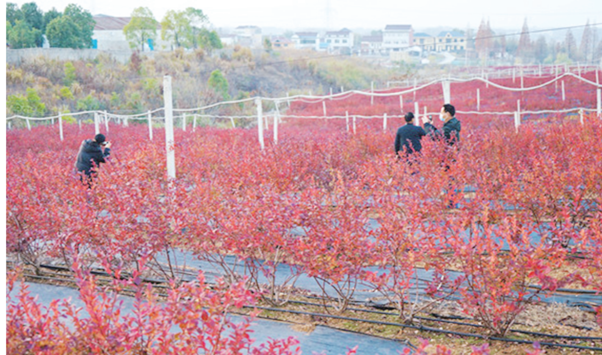
冬日里,游客在怀宁县清河乡蓝莓基地里游玩拍照。

在怀宁县石镜乡邓林村山谷中,望春花已在此盛开了500多年。每到春天,20余万株望春花怒