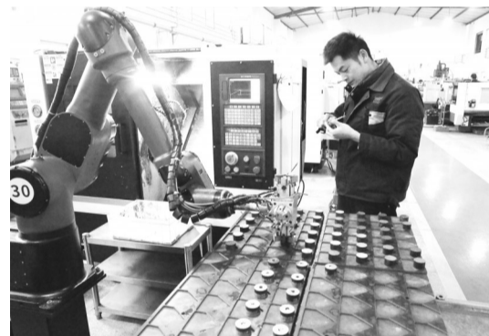
被国家工信部评为专精特新“小巨人”企业的安庆牛力模具公司机器人正在生产不同类型的模具。