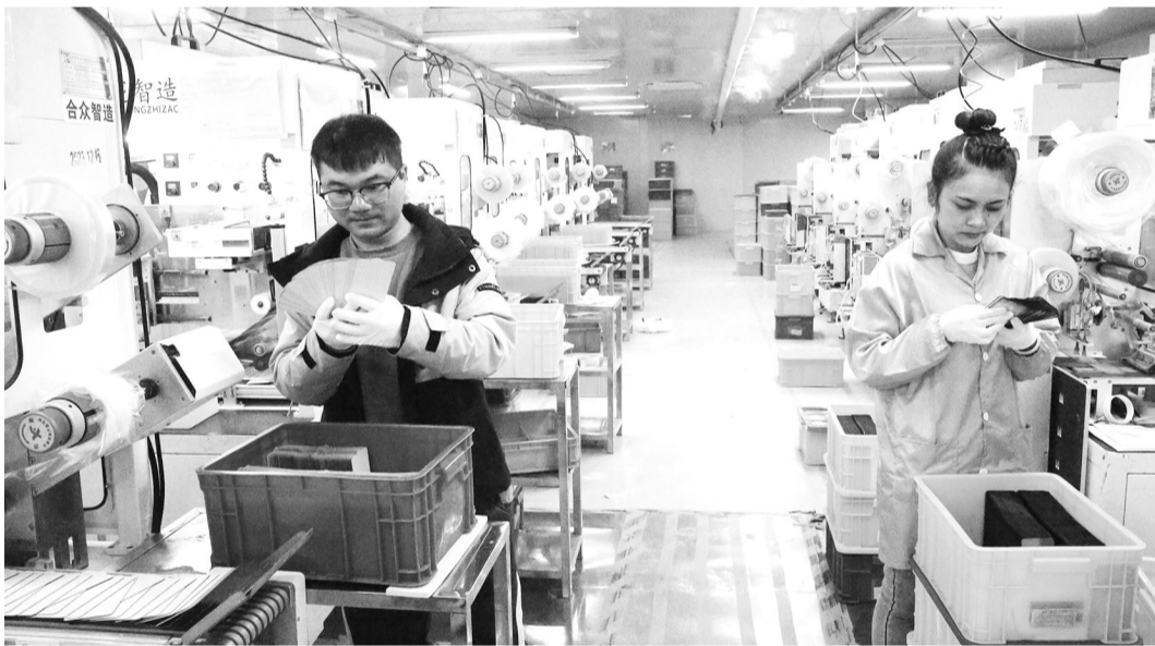
太湖巨泰视显光电公司员工正在智能化车间检查手机钢化膜质量,其产品主要出口东南亚等国际市场。