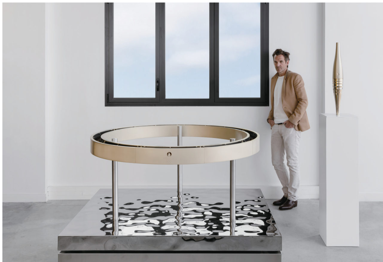
5月6日,巴黎奥组委正式公布了奥运及残奥火炬接力火种台的设计方案,该火种台由设计了巴黎奥运火炬的法国著名设计师马修·勒汉纽尔操刀完成,实物形象上与奥运火炬也高度融合;同时还公布了给每位火炬手的纪念品——名为“火炬之心”的圆环。这是设计师马修·勒汉纽尔与火种台合影。

在以往的奥运会及残奥会火炬接力中,通常会将火炬作为纪念品赠予火炬手。但本届奥运会为了突