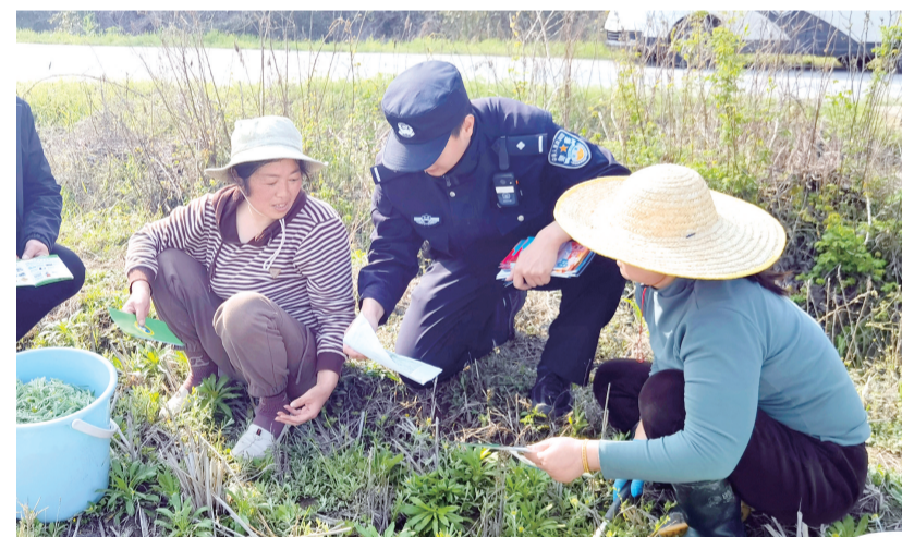
近日,望江县鸡鸣镇结合辖区春耕实际情况,公安民警和禁毒工作者深入田间地头,向村民宣传禁毒知识,教会村民识别罂粟等毒品原植物,宣传毒品原植物危害。