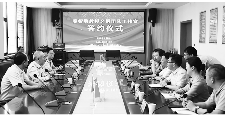
工作室签约仪式现场。