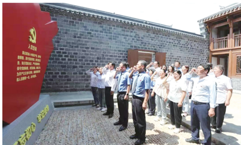
近日,大观区检察院组织党员干部与桐城市检察院联合开展学党史、明规矩、强党性主题党日活动,不断筑牢拒腐防变的底线,让党史学习教育入脑入心。