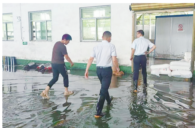
深入桐城市某塑胶公司受灾区域进行查勘工作。