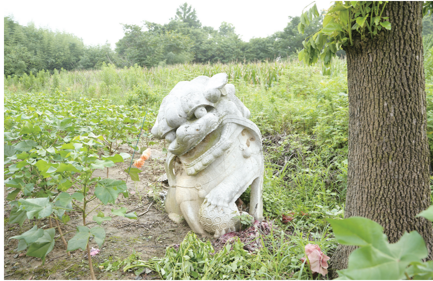
倪氏宗祠遗址现存石狮。

洪水,是陪伴人类成长的现象;洪水,则是贯穿人类历史的灾害。众所周知,同样是人类,不同文明对待洪水的态度并不相同。在中国,则从来不缺愿意与洪水进行顽强斗争的那群人——当然,是有策略地斗争。