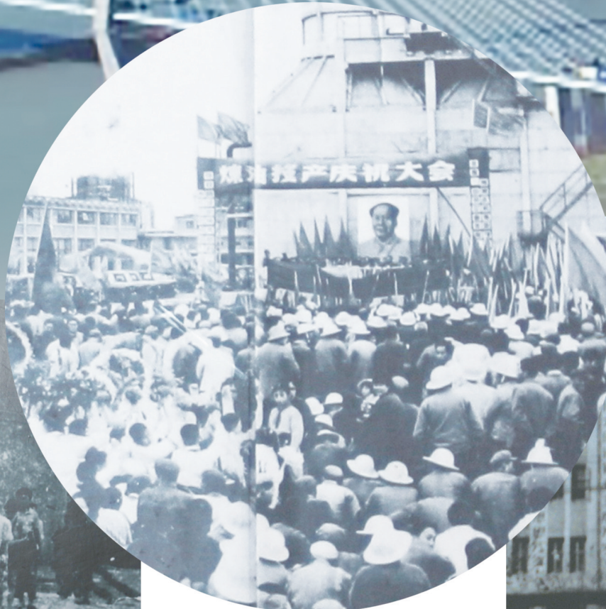
▲1976年11月9日，炼油投产庆祝大会。1978年1月2日，安庆石化炼油厂全部装置投入生产。