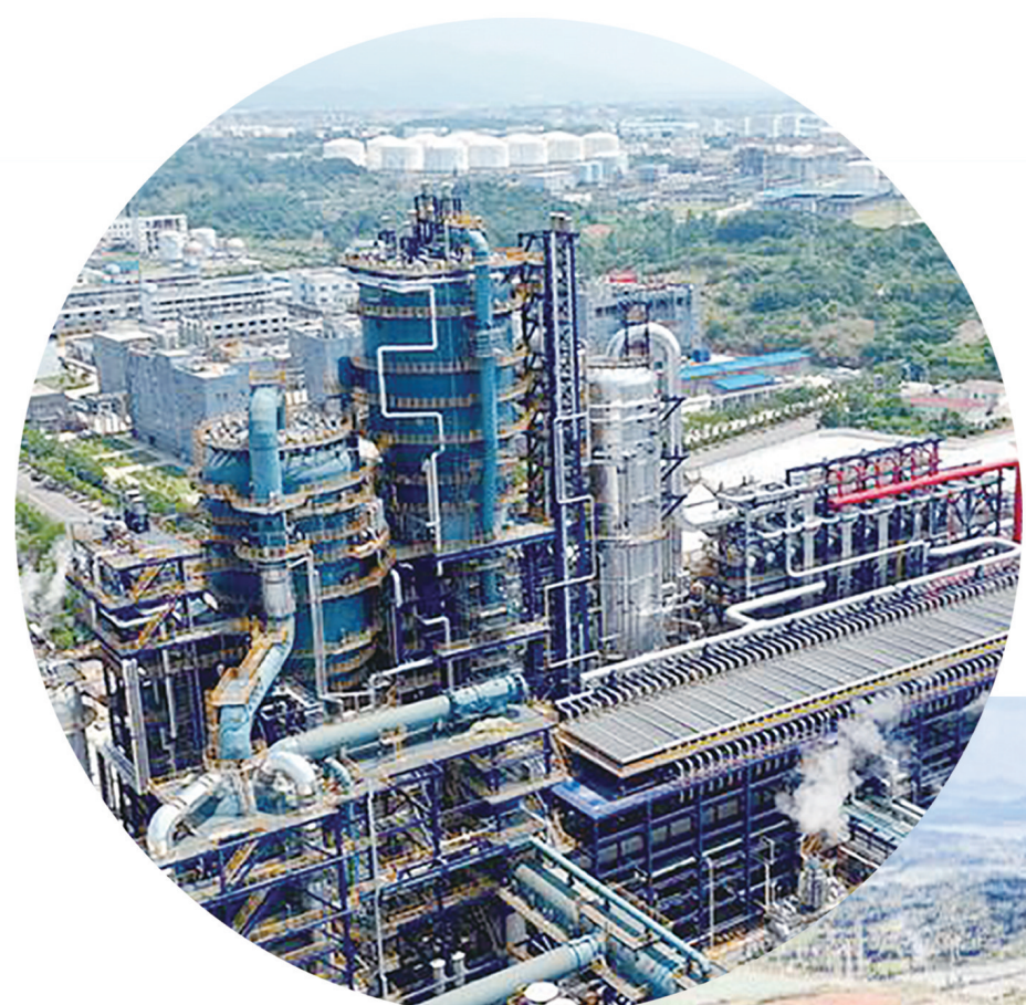
▲2023年6月30日，安庆石化300万吨/年重油催化裂解装置一次投料开车成功，产出合格产品，标志着中国石化成为重油催化裂解技术路线应用的领跑者。

专刊不仅是一份历史的见证，更是一曲奋进的赞歌。每一张图片都是一个故事，每一帧画面都蕴含着深厚的情感。站在新的历史起点上，安庆正以崭新的姿态迎接挑战，拥抱机遇，努力打造成为长三角区域的重要节点城市，向着更远的目标迈进。让我们一同回首往昔，携手并进，共创安庆更加辉煌灿烂的明天！