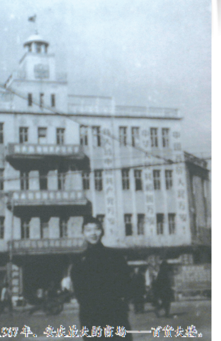
1937年，安庆最早的街景——一街一巷。