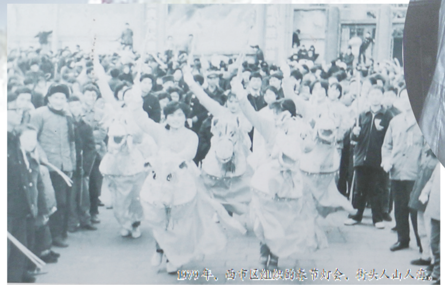
1979年，西河区血站启动仪式，街头人山人海。