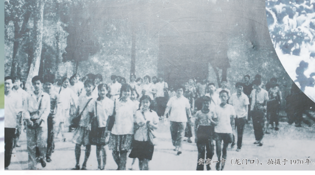
安庆一街（龙门口），拍摄于1970年。