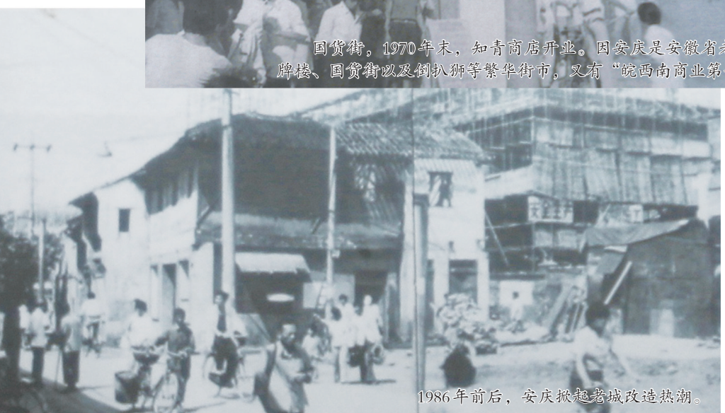
1986年前后，安庆城隍庙周边街景。