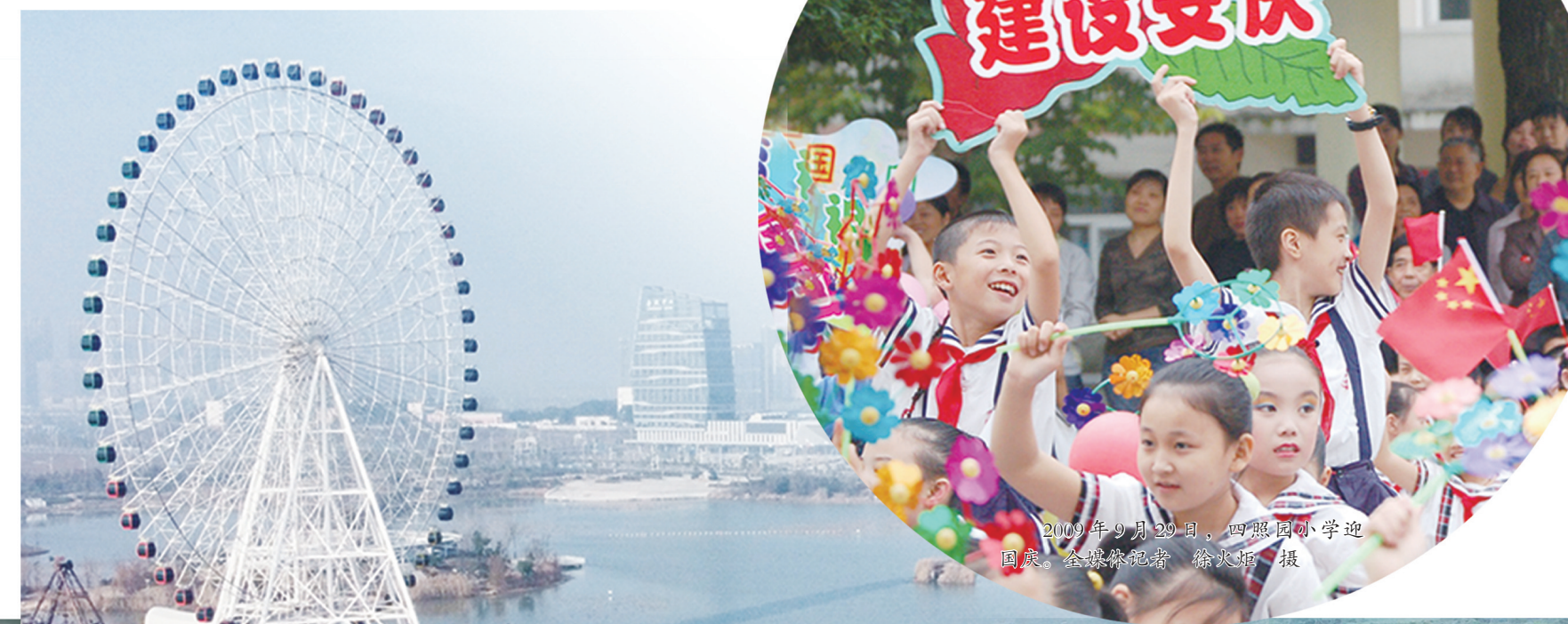
▲2024年9月10日，迎江区小学迎国庆主题活动，小朋友们手持国旗，欢度佳节。