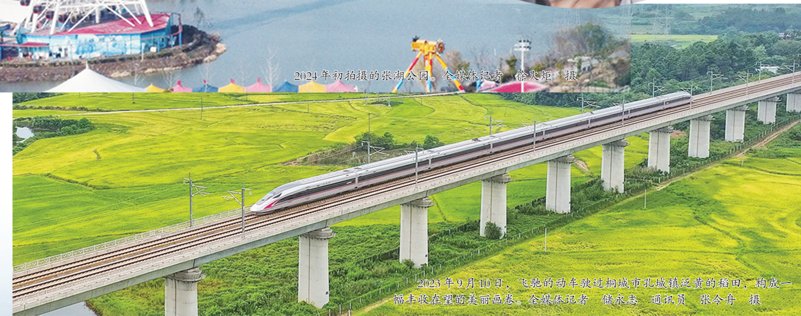
▲2023年9月10日，飞驰的动车穿越皖南丘陵，展现一幅丰收画卷。