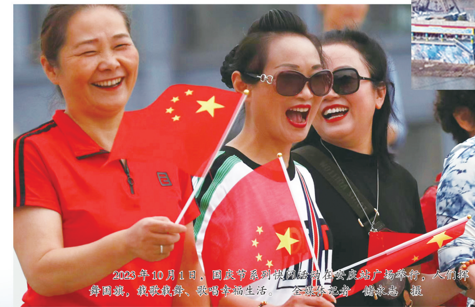
▲2023年10月1日，国庆节当天，市民们在安庆路广场举行升旗仪式，欢歌劲舞，共庆华诞。