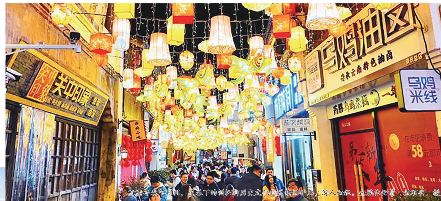
▲2024年9月10日，在太平街新街历史文化街区，市民们欢聚一堂，共庆国庆佳节。