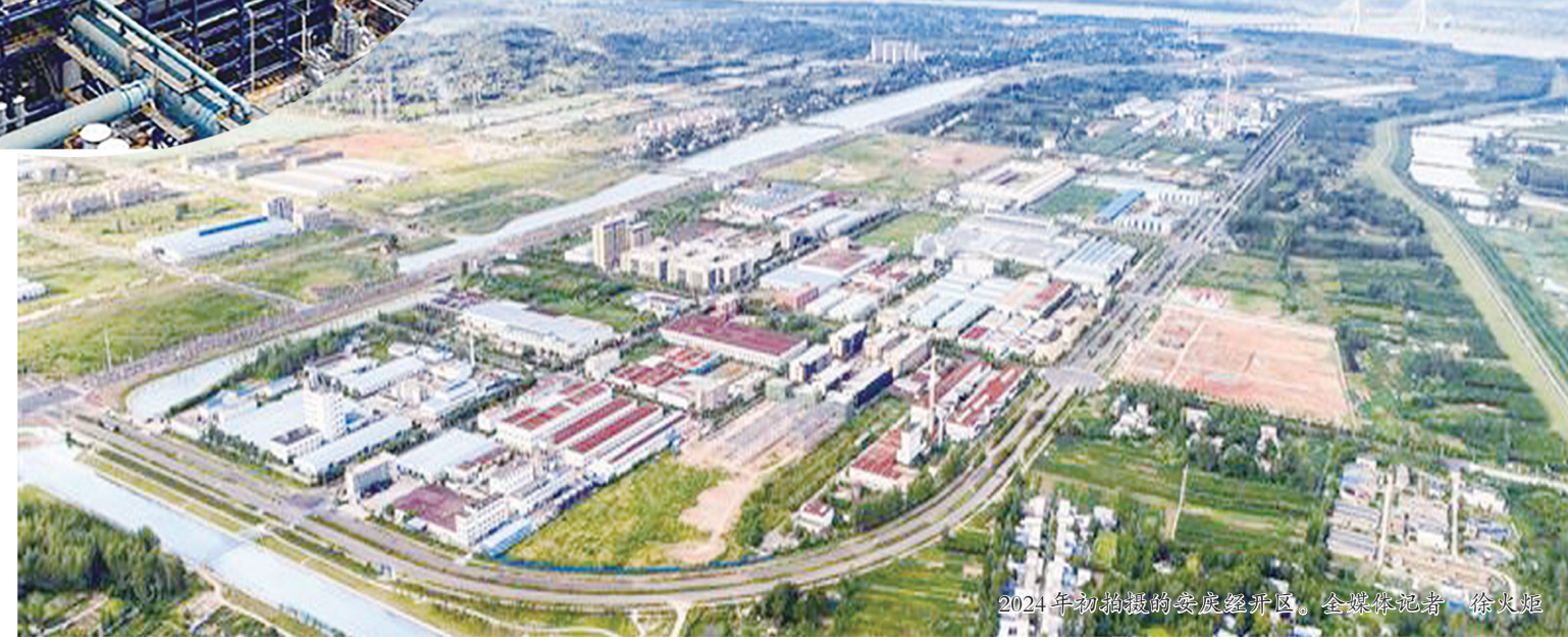
▲2024年初拍摄的安庆经开区，高楼林立，绿树成荫。