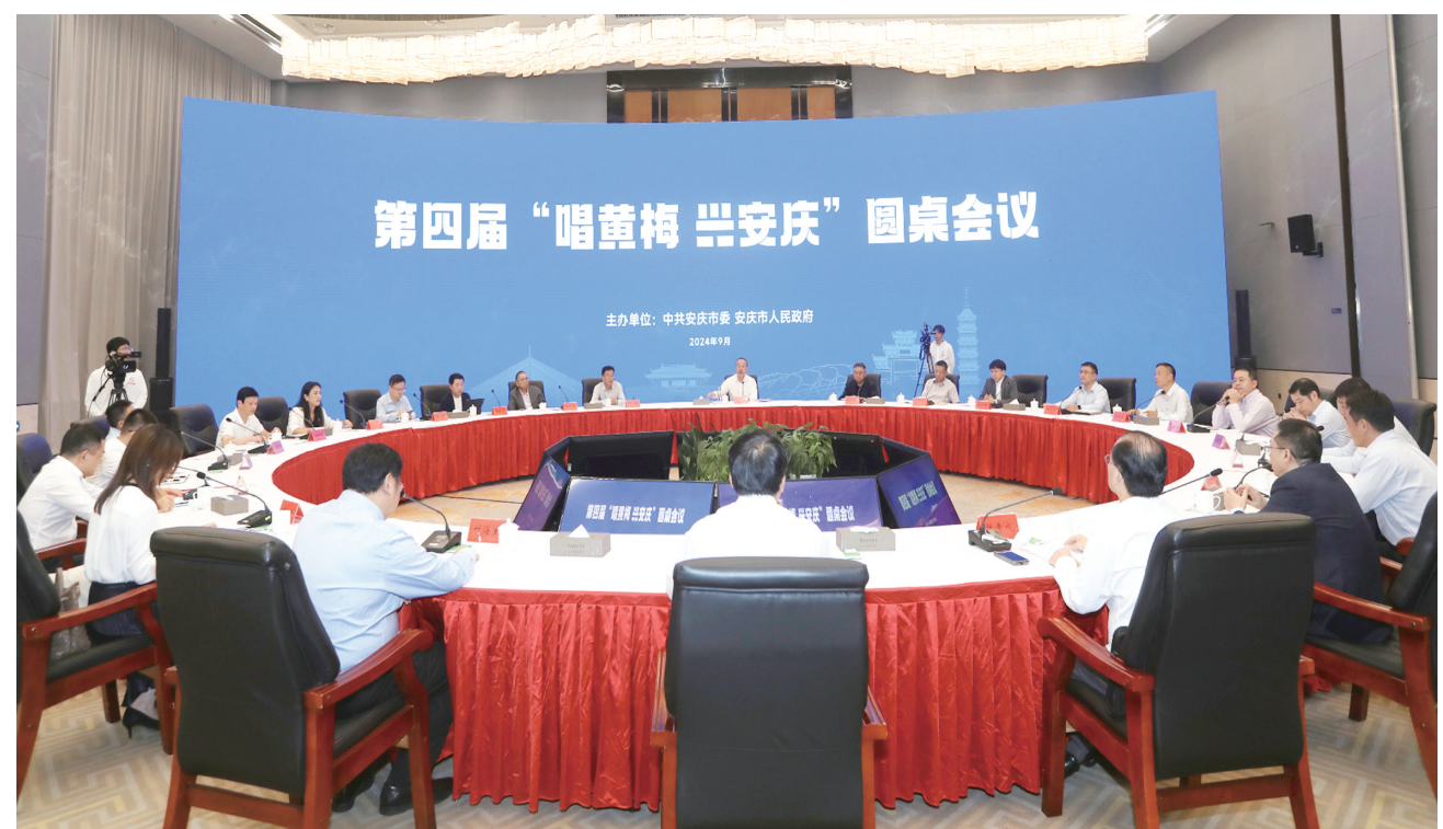
9月28日,第四届“唱黄梅、兴安庆”圆桌会议举行。

会议指出,近年来,安庆坚持“内搭平台、外联老乡”发展路径,积极运用历次圆桌会议成果,扎实推进金融高质量发展,全市金融事业呈现稳中有进发展势头;在金融稳健发展的有力支撑下,安庆经济社会发展呈现稳中向好、稳中提质态势。这些成绩的取得,离不开省金融管理部门、各金融机构,安庆籍金融界“大咖”和企业家的鼎力支持。