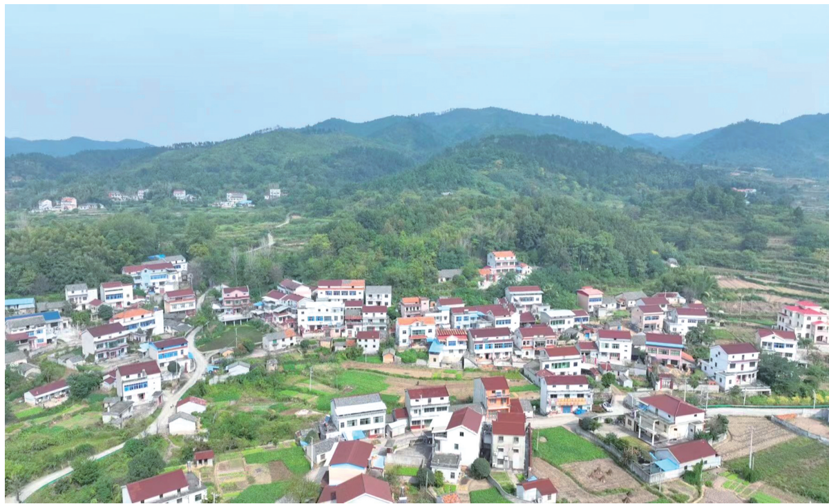
怀宁县江镇镇上丰村新貌。

何刘竹的祖父何承焰,继承了何世来传下来的革命传统,1950年作为志愿军战士奔赴抗美援朝的战场。在经历过血与火的战场后,何承焰回到家乡做了一个普通农民。艰苦的战斗岁月也让何承焰落下了顽疾,他去世时年仅50多岁。